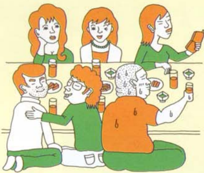
合コンでいいオトコがない時